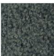
047 Smokey Mount