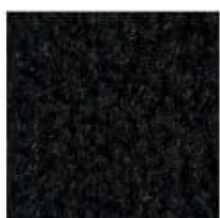
211 Raven Black