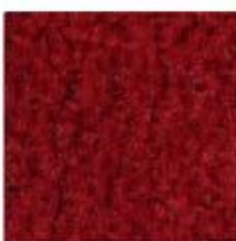
845 Regal Red